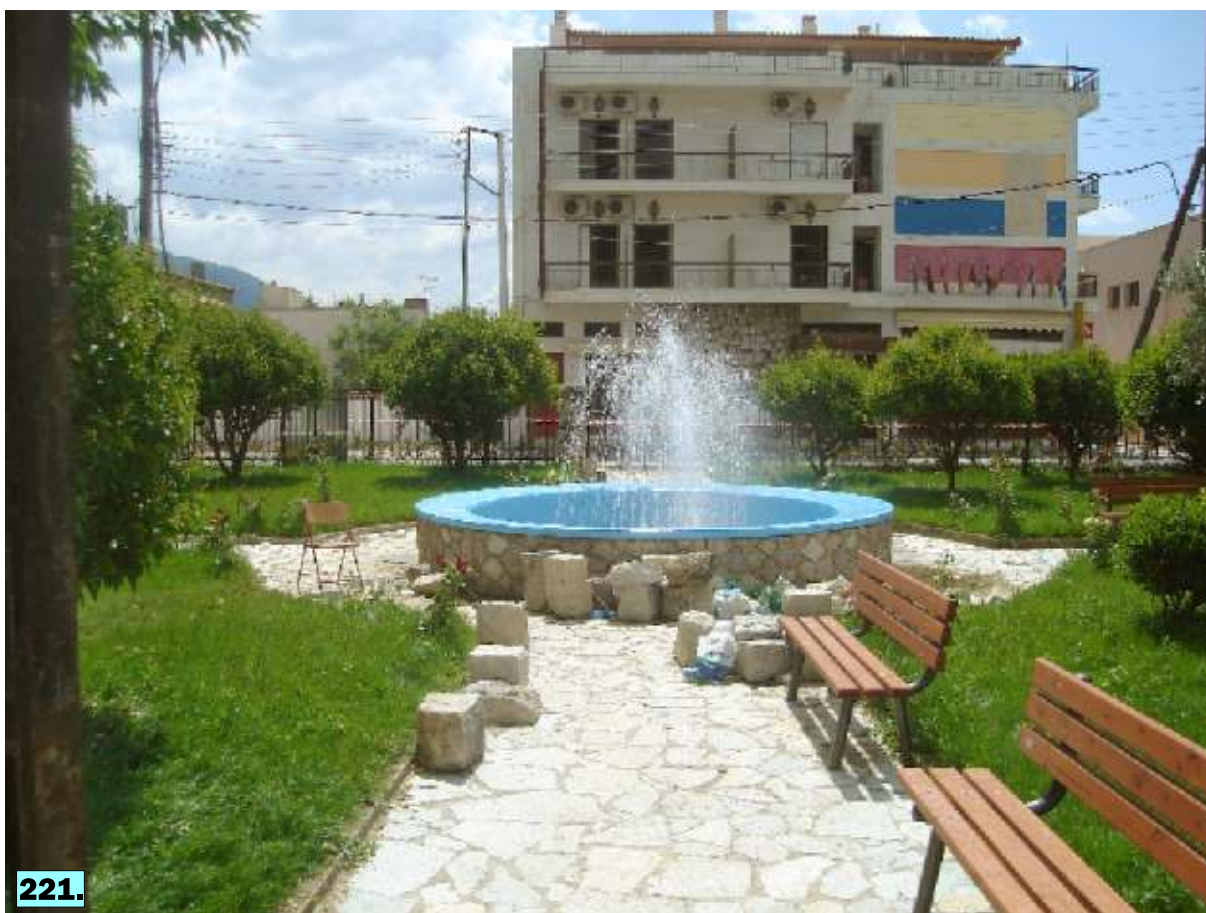
221: Το συντριβάνι που λειτούργησε στο χώρο του σχολείου μας.

Επιπλέον, δόθηκαν σε όλους ως αναμνηστικά του προγράμματος η μπλούζα με τη φωτογραφία τους στην πλατεία Κεχαγιά (βλ. παράρτημα παραδοτέων), ένα μπουκαλάκι με έναν πλαστικό δακτύλιο (παιχνίδι) που δημιουργεί σαπουνόφουσκες, δέκα (10) φωτογραφίες από δραστηριότητες με το νερό στο κάθε παιδί, καθώς και ένας έπαινος για τη συμμετοχή τους στο πρόγραμμα (βλ. παράρτημα παραδοτέων).