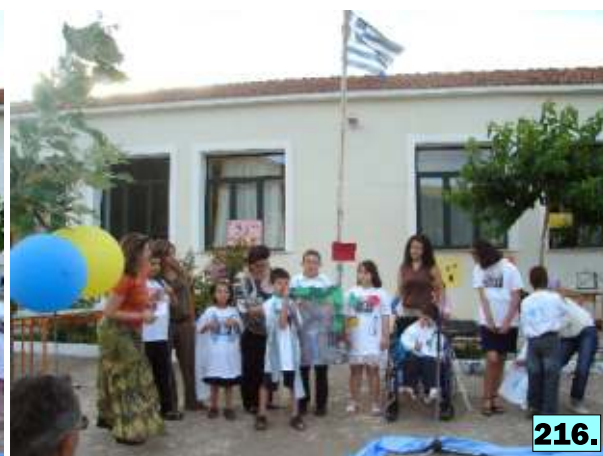
213-216: Η εκδήλωση στο Σερνικάκι στις 8-6-06.

Προσπαθώντας να αξιολογήσουμε το βαθμό κατανόησης των παιδιών γύρω από τη χρήση, την προέλευση και τον κύκλο του νερού, δημιουργήσαμε ένα ερωτηματολόγιο, αποτελούμενο από έντεκα (11) απλές ερωτήσεις σύμφωνα με τα όσα συζητούσαμε μέσα στην τάξη. Από τα δώδεκα (12) παιδιά που συμμετείχαν στο πρόγραμμα τα δύο (2) δεν κατάφεραν να απαντήσουν, λόγω σοβαρών δυσκολιών στον τομέα της επικοινωνίας. Εν τούτοις, πρέπει να σημειώσουμε ότι το ένα από αυτά τα παιδιά, ηλικίας 7 ετών με σοβαρή ψυχοκινητική και εξελικτική καθυστέρηση, με δική του πρωτοβουλία (για πρώτη φορά) χρησιμοποίησε το μπλε μαρκαδόρο και θέλησε να ζωγραφίσει, όταν τα υπόλοιπα παιδιά έκαναν τις ζωγραφιές τους για τη λίμνη του Μόρνου στην πλατεία του